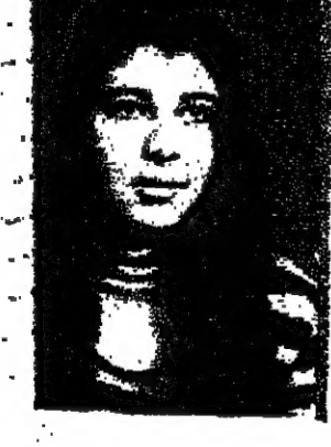
ومع هذا اللقاء المحفظ نقل تحب بالروابط العائلية، وروابط ومقبة، هاهي تخاطب اخفا في قد اثناء تعالي تملك باقة ورد لمره النسب تعالي نواصي الحزينة جرحتها بقايا الطوب جرحتي، تعالي تطف الريام نغصه على رؤوسنا، وتنطلق بلا تيود.

اللون الذي كتبه قصيدة ضمن قصيدة التتر وجداني وعاطفي واجتماعي أيضا. انها تتبني من العائلة العربية في هذه البلاد المتلثة حضاريا بما تعلمه وتشاهده ونحك به في المدرسة، والتفكير في المجتمع الجديد مع قاعدة التحفظ العلم. ويظل «بر الامان» القصيدة التي وقع نظري عليها الآن نقل هذه القصيدة بحفظاتها الاجتماعية تدل على ما نحس به الفتاة العربية من تقي بالمدادات والتقاليد التي يفرضها المجتمع والدين والأخلاق. هناك الملتنا حبكة الشباب انبتت الابل بين النلال غناب الحزن عنا انا وهي وهو بحثنا عن بر الابان